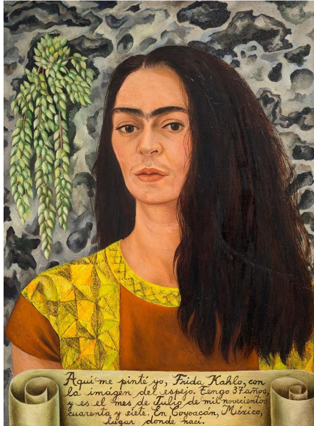
Frida con blusa de satén azul , 1939, Nickolas Muray (estadounidense, nacido en Hungría, 1892–1965), impresión al carbón. Colección privada

Las entradas para la ansiada exposición Frida: más allá del mito salen a la venta el 1.º de febrero El Virginia Museum of Fine Arts, uno de los dos únicos museos de Estados Unidos donde se presenta la exposición, la inaugurará con el festival ¡FridaFest!